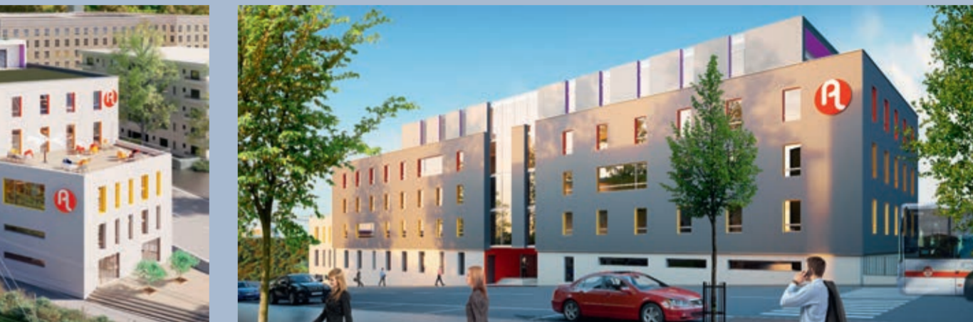
Architecte : O. Gauby - a studio

Sur les derniers terrains constructibles à Vourles, dans le respect du dernier Plan Local d'Urbanisme, le Groupe em2c poursuit aujourd'hui l'extension de la zone en développant 7,5 ha destinés à l'activité, au négoce et au tertiaire. Comme pour les tranches précédentes, le foncier est maîtrisé, viabilisé et aménagé pour être rendu rapidement opérationnel et mis sur le marché. Il est à ce jour divisé en 10 lots allant de 3 000 à 15 000 m 2 et peut déployer jusqu'à un total de 35 000 m 2 de surface constructible. Un choix à la carte pour coller aux besoins de surfaces différents des entreprises qui souhaiteraient s'y implanter.