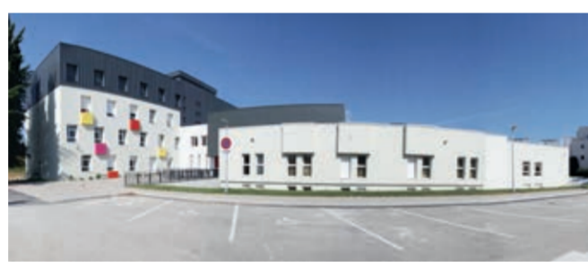
Cocoon la Roseraie