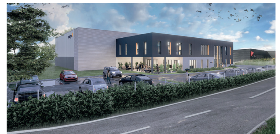
AZERGO – ARCHITECTE : MAROUN KHATTAR

La Zone d'Activités Les Plattes est développée, aménagée et réalisée par le Groupe em2c depuis 2004. Elle s'étend sur 16,5 ha avec l'implantation réussie d'une cinquantaine d'entreprises (tertiaire, activité, négoce). ■