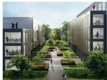
ARCHITECTE: ALFONSO FEMIA

4 800 m 2 - Réalisation d'un ensemble de 2 immeubles tertiaires avec socle actif (commerce).