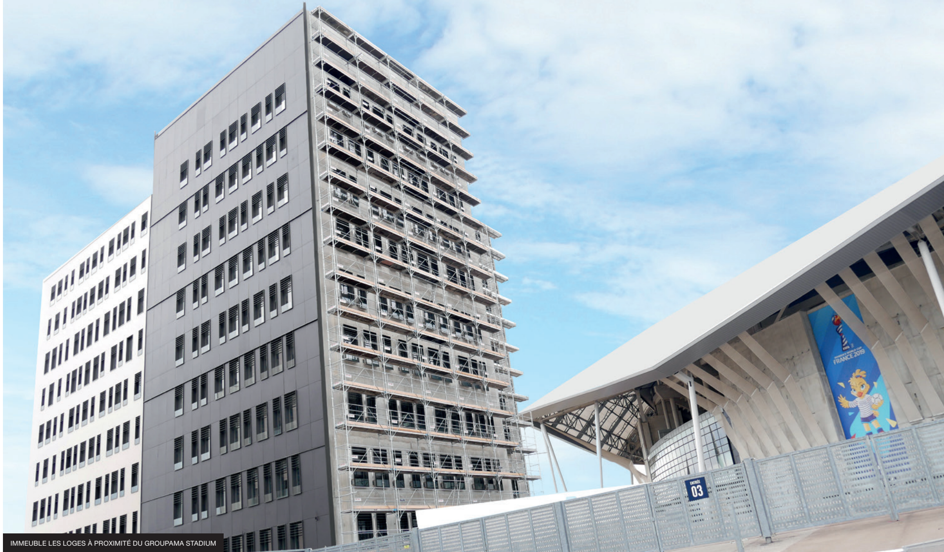
IMMEUBLE LES LOGES À PROXIMITÉ DU GROUPAMA STADIUM