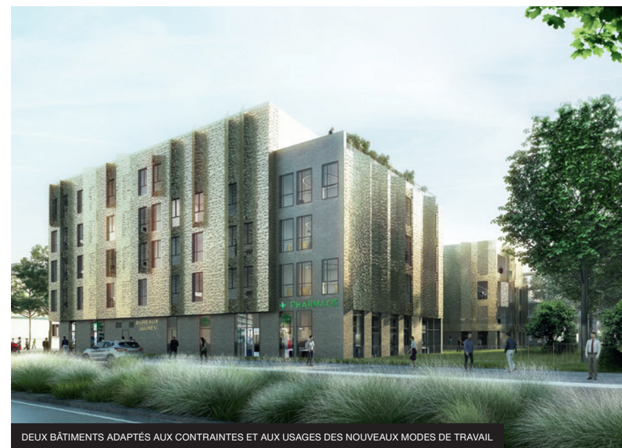
DEUX BÂTIMENTS ADAPTÉS AUX CONTRAINTES ET AUX USAGES DES NOUVEAUX MODES DE TRAVAIL

DIPTYK est le fruit d'un immobilier à l'écoute d'un quartier vivant et des nouvelles réalités économiques des entreprises. Tout a été pensé afin de garantir des coûts d'exploitation très compétitifs conjugués à des loyers et des prix de vente fortement concurrentiels. Un produit complet pour la nouvelle économie urbaine dans un quartier d'affaires promis à un avenir rayonnant. ■