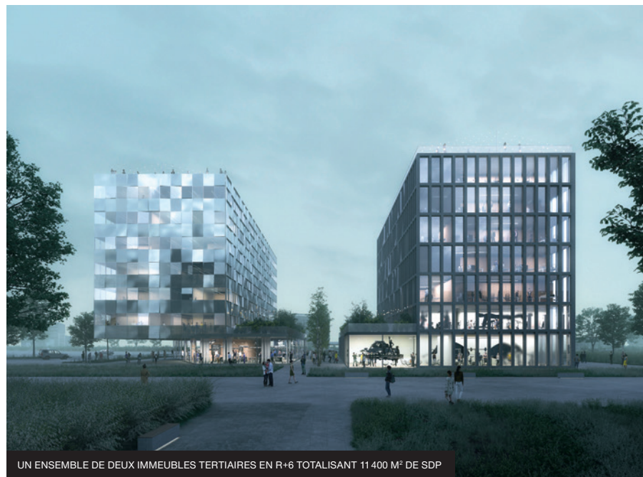
UN ENSEMBLE DE DEUX IMMEUBLES TERTIAIRES EN R+6 TOTALISANT 11 400 M 2 DE SDP

« Dessine-moi Toulouse » vise la mise en valeur de la métropole à travers les nouvelles manières de « faire la ville », unissant nouveaux usages, qualité architecturale, attractivité économique et implication