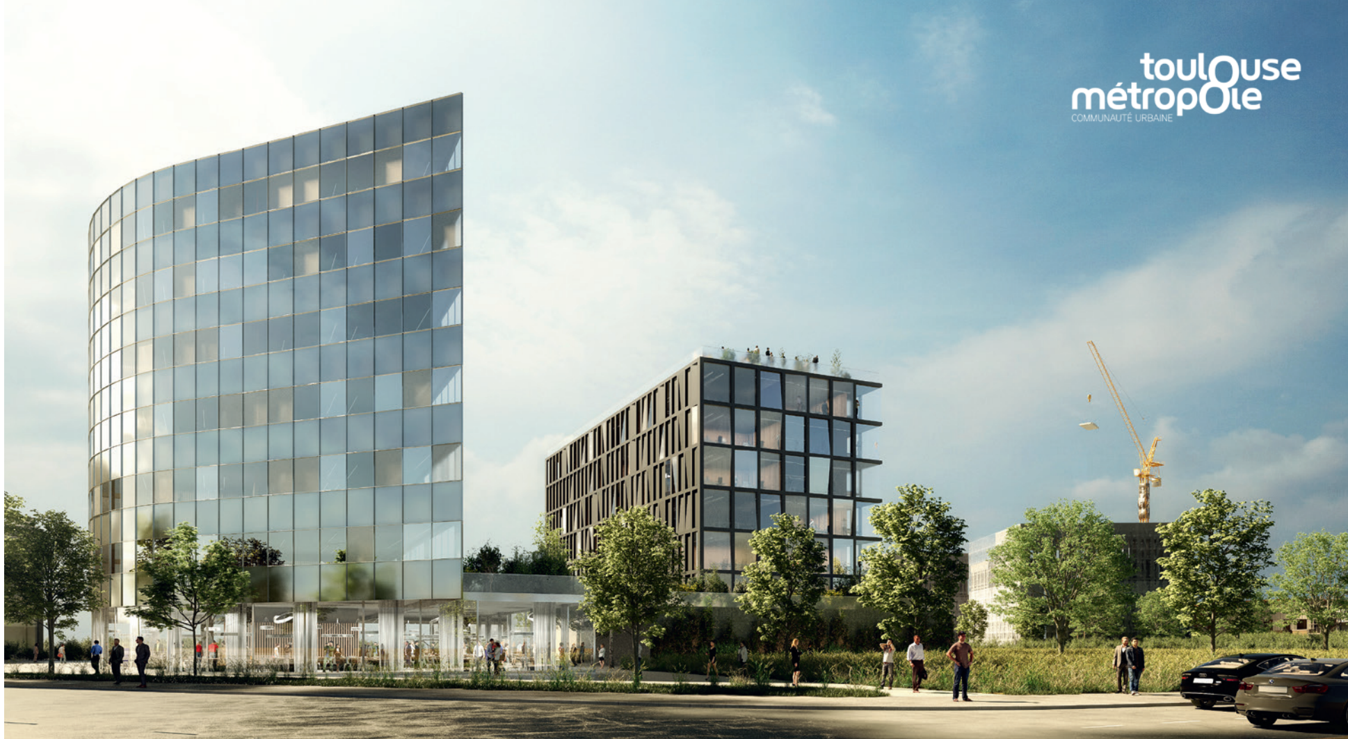
ARCHITECTE: ALFONSO FEMIA – ATELIER(S) AF 517