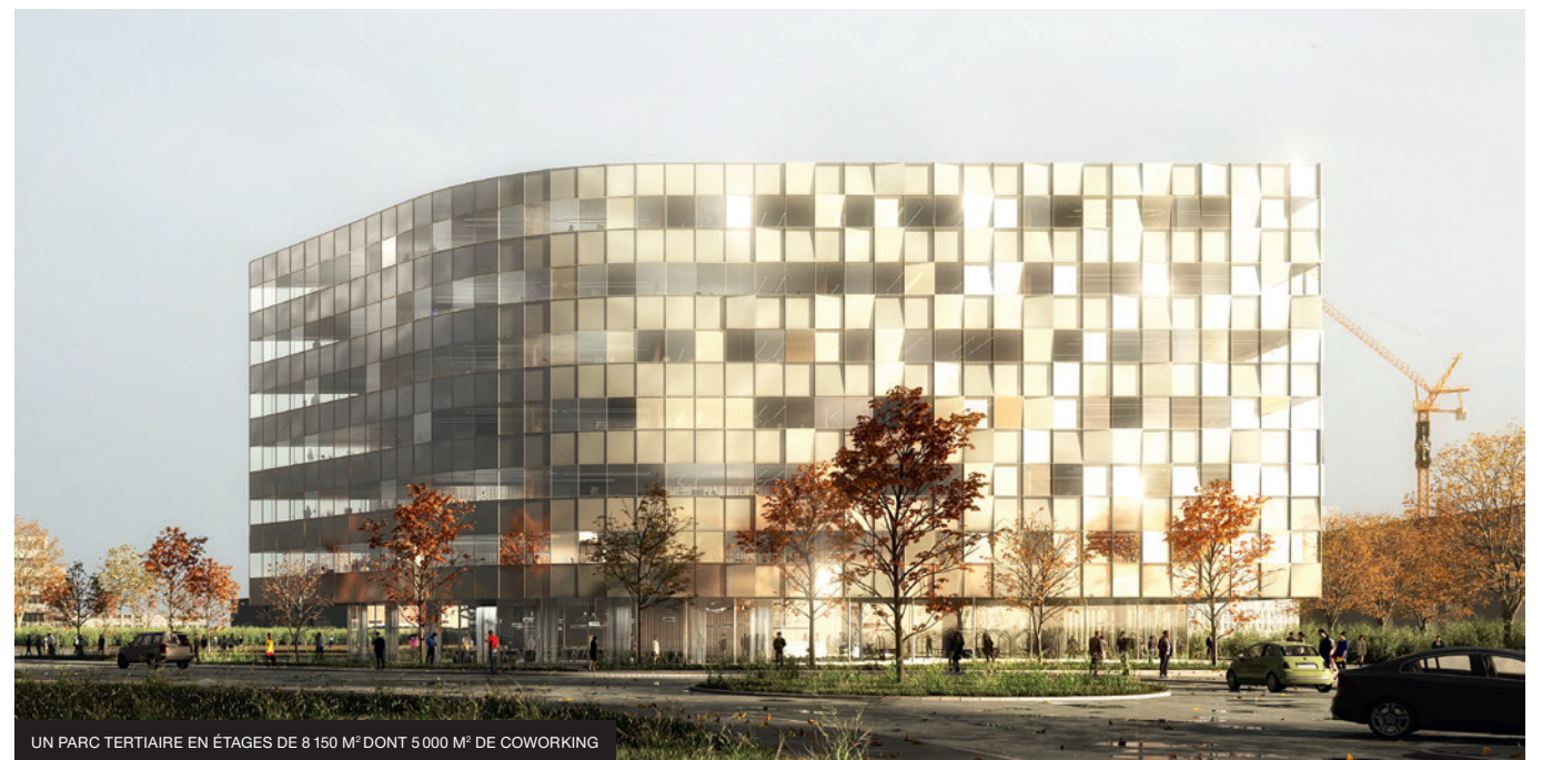
UN PARC TERTIAIRE EN ÉTAGES DE 8 150 M 2 DONT 5 000 M 2 DE COWORKING

Accompagner le développement économique, contribuer à la transition énergétique, intégrer la nature dans la ville, favoriser la qualité de vie et des échanges, encourager les déplacements doux... SKY ONE constituera un site exemplaire et vertueux, une vitrine de la Métropole et de son caractère innovant. ■