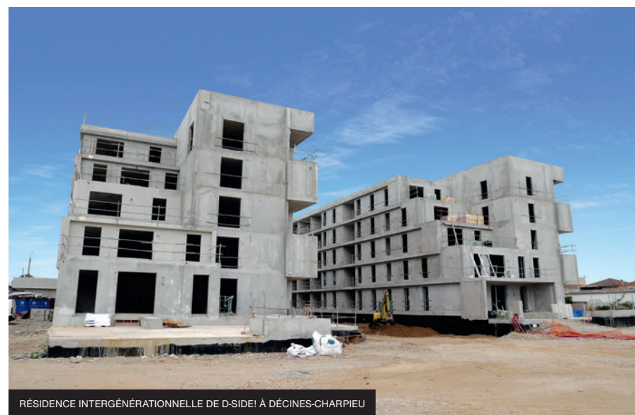
RÉSIDENTICE INTERGÉNÉRATIONNELLE DE D-SIDE! À DÉCINES-CHARPIEU

Après 11 mois de travaux, le centre de tri et de valorisation Paprec de Chassieu (69) sera livré début août 2019. Les 7500 m 2 de ce bâtiment industriel de 18 mètres de haut accueilleront bientôt 3500 m 2