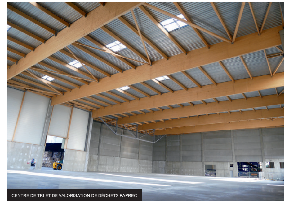
CENTRE DE TRI ET DE VALORISATION DE DÉCHETS PAPREC

Au total, ce sont plus de 116000 m 2 qui sont en cours de réalisation à l'été 2019. ■