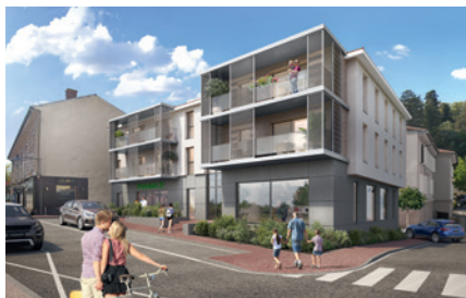
CARRÉ LISON - ARCHITECTE: OLIVIER GAUDY

LE LYAUD (Haute Savoie près de Thonon-les-Bains) est une opération plus importante puisqu'elle développe un ensemble immobilier de 3800 m 2 . Elle comprend une résidence autonomie de 25 appartements seniors pour le compte du groupe ODELIA,