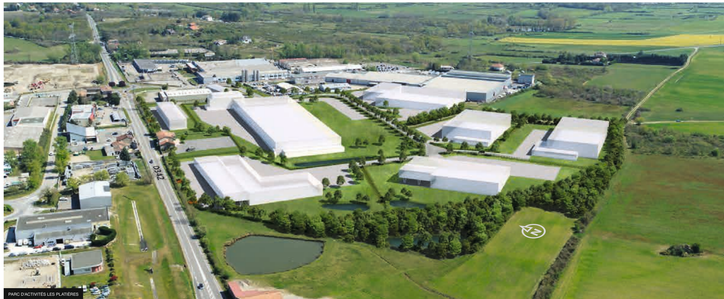
PARC D'ACTIVITÉS LES PLATIÈRES