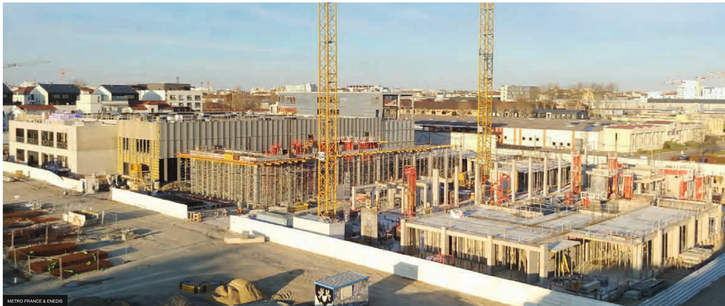
METRO FRANCE & ENEDIS