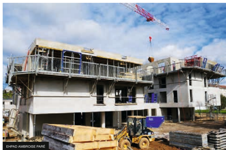
EHPAD AMBROISE PARÉ