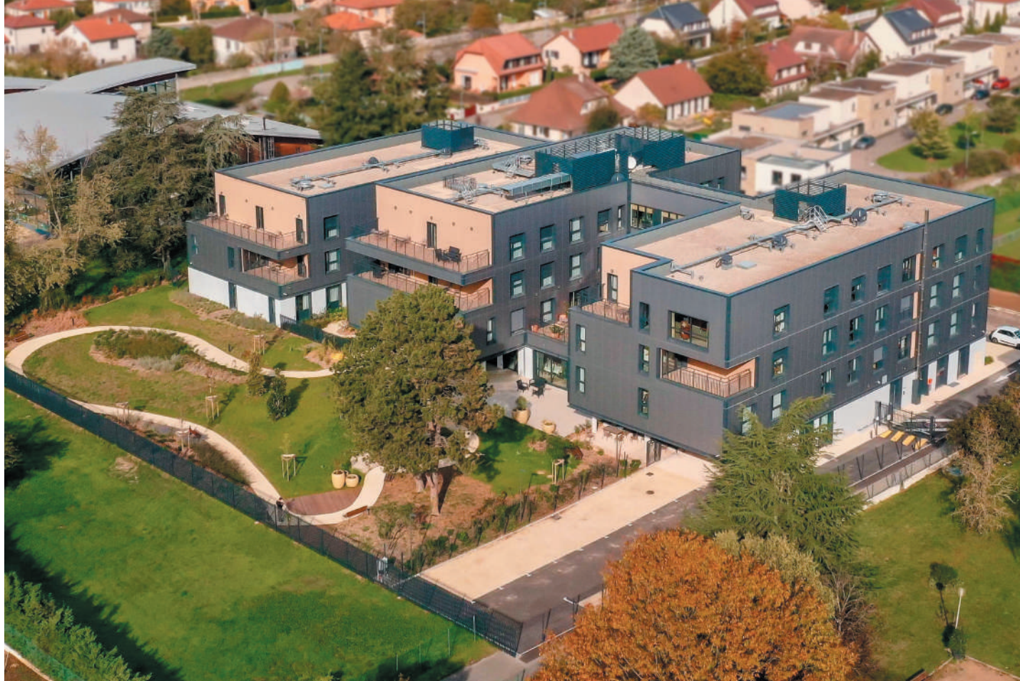
ARCHITECTE : SUD