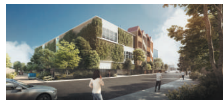
ARCHITECTE : URBENSE

HOTEL DE DISTRIBUTION UBAIN DURABLE SUR LE PARC MIXTE DELTALYS – VÉNISSIEUX (69) 28 000 m 2