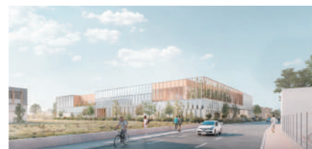
ARCHITECTE : DIDIER DALMAS

ENSEMBLE MIXTE COMMERCE DE GROS / PARC D'ACTIVITÉ ARTISANAL MÉTROPOLE DE LYON (69) 15 000 m 2