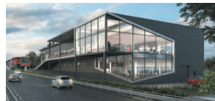
ARCHITECTE : XANADU

CONCESSION AUTOMOBILE VÉNISSIEUX (69) 5 000 m 2