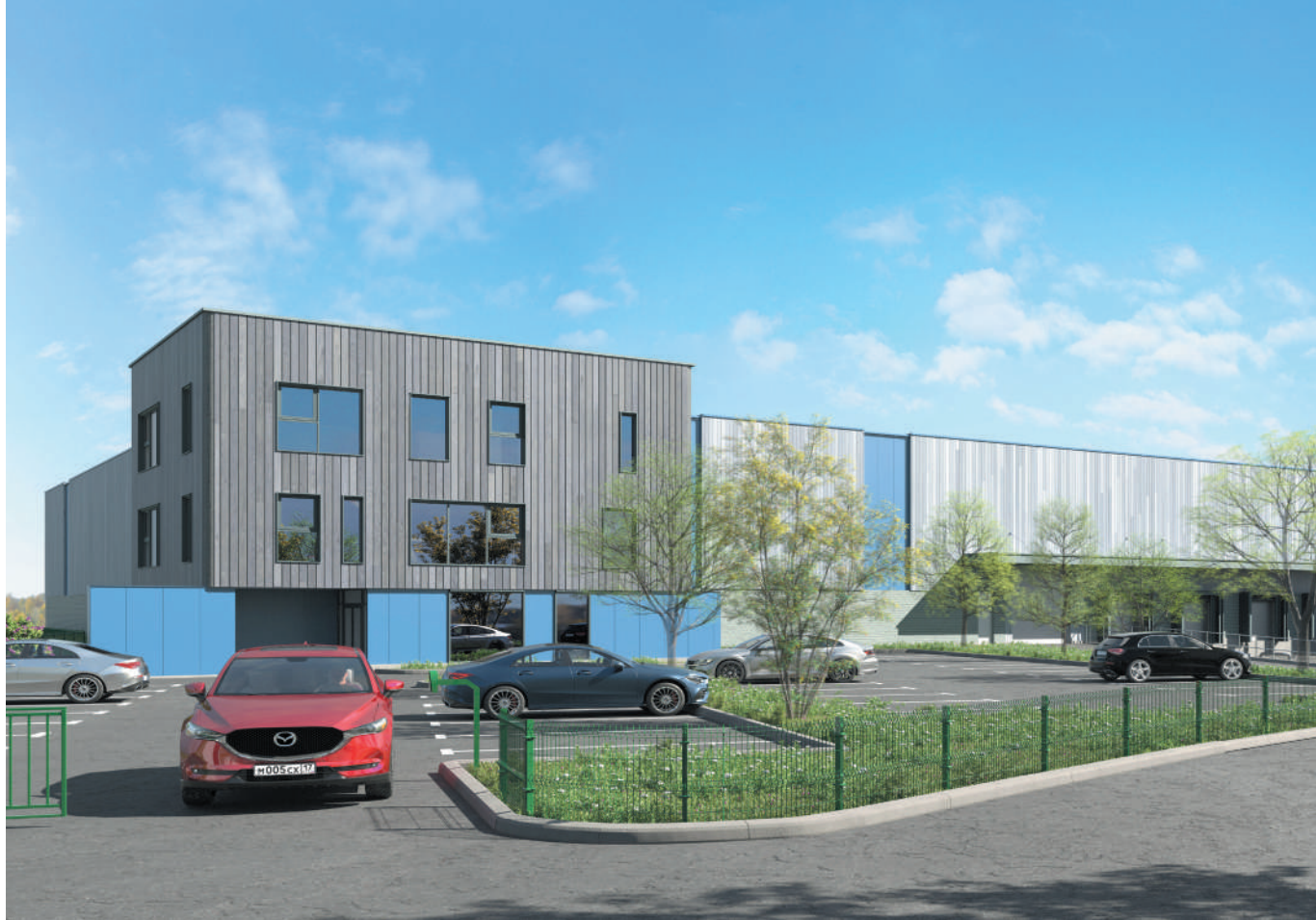
ARCHITECTE : aSTUDIO