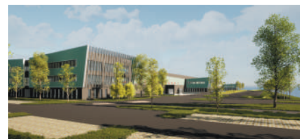
ARCHITECTE : ARCHIGROUP

CARGOPORT - RHÔNE (69) 22 000 m 2 : conception d'un bâtiment de messagerie et de bureaux