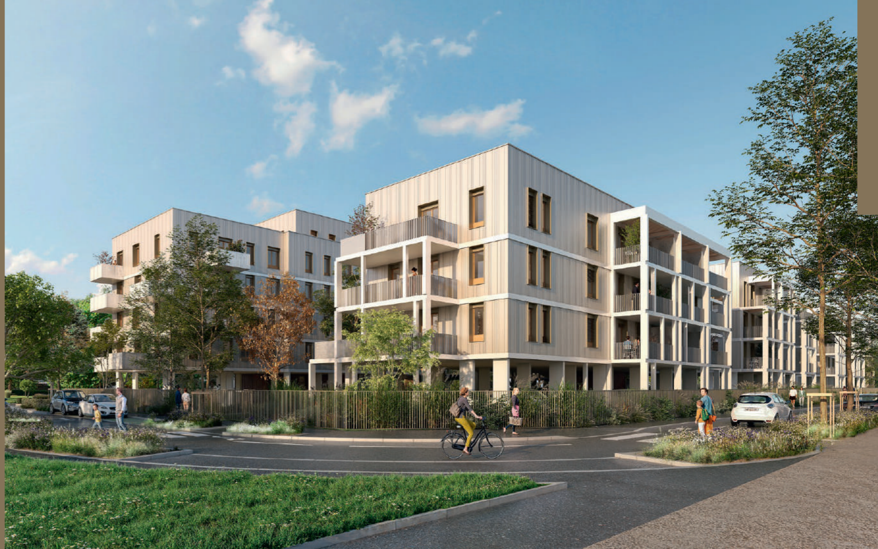
EMMANUELLE ANDREANI ARCHITECTES

Engagé il y a plusieurs années, le projet de requalification du quartier du Vallon prend un nouvel élan avec BOCAGE : programme lauréat de l'appel d'offre lancé par la ville de Grigny-sur-Rhône et la Métropole de Lyon, porté par em2c Promotion avec le cabinet Emmanuelle Andreani Architectes.