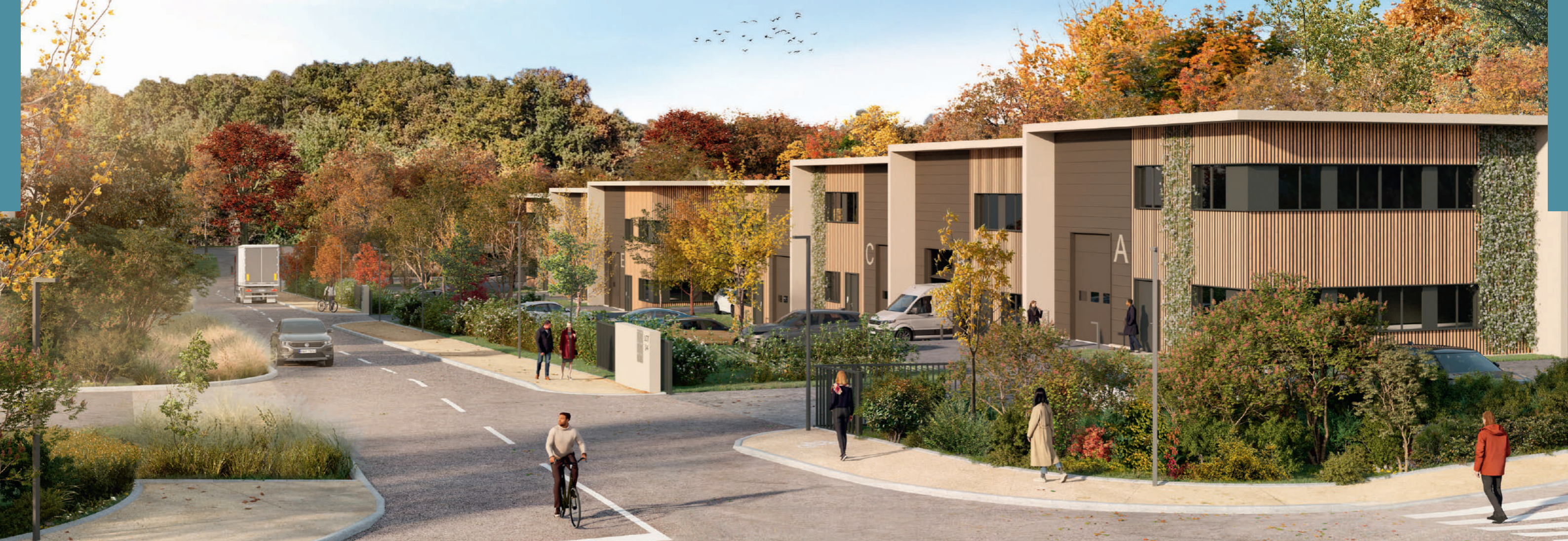
Architecte : QUI PLUS EST